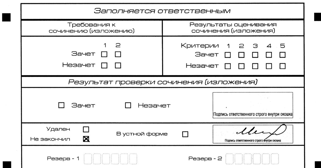
Рис. 12. Заполнение полей нижней части бланка регистрации (завершение написания сочинения (изложения) по уважительным причинам)

В случае если участник итогового сочинения (изложения) по состоянию здоровья или другим объективным причинам не может завершить написание итогового сочинения (изложения), он может покинуть место проведения итогового сочинения (изложения). Члены комиссии по проведению итогового сочинения (изложения) составляют «Акт о досрочном завершении написания итогового сочинения (изложения) по уважительным причинам» (форма ИС-08), вносят соответствующую отметку в форму ИС-05 «Ведомость проведения итогового сочинения (изложения) в учебном кабинете ОО (месте проведения)» (участник итогового сочинения (изложения) должен поставить свою подпись в указанной форме). В бланке регистрации указанного участника итогового сочинения (изложения) необходимо внести отметку «Х» в поле «Не закончил» для учета при организации проверки, а также для последующего допуска указанных участников к повторной сдаче итогового сочинения (изложения) в дополнительные сроки. Внесение отметки в поле «Не закончил» подтверждается подписью члена комиссии по проведению итогового сочинения (изложения).