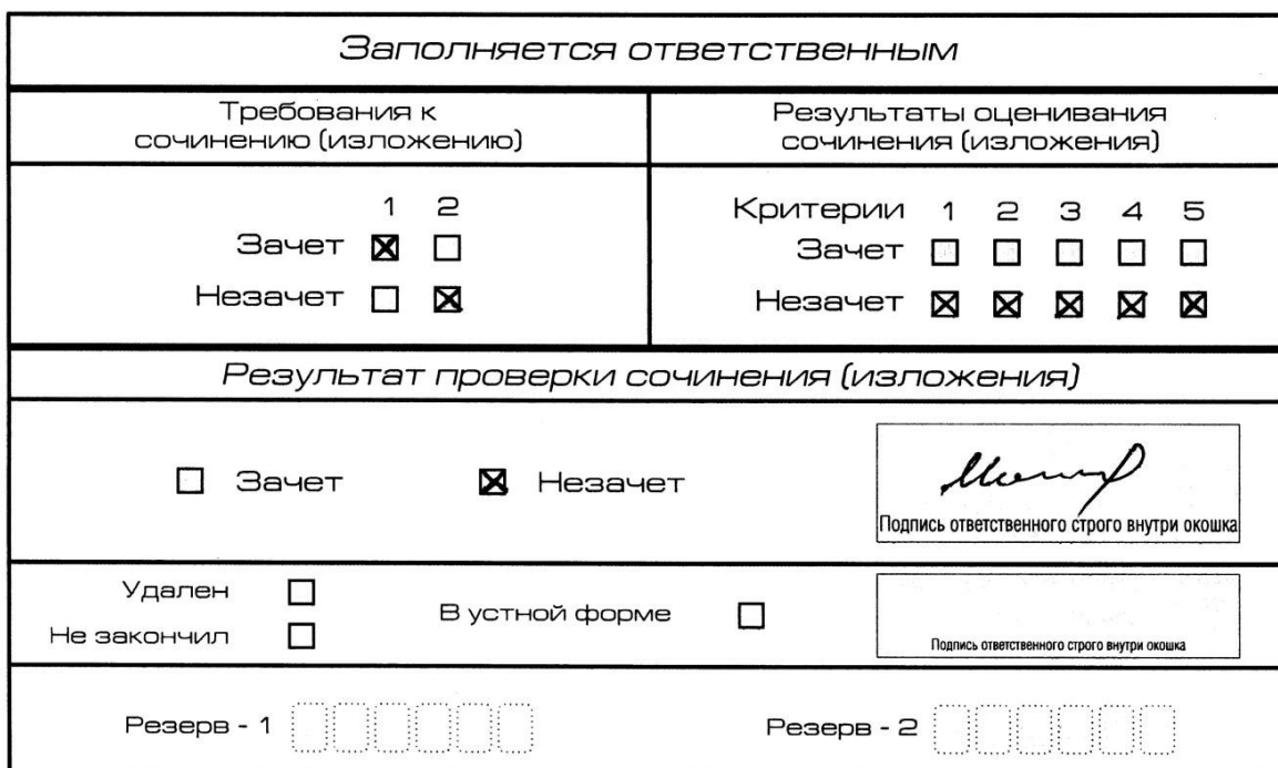
Рис. 9. Область для оценки работы

Если итоговое сочинение (изложение) соответствует требованию № 1 и требованию № 2, то выставляется «зачет» за выполнение требования № 1 и требования № 2. Указанные сочинения (изложения) далее оцениваются по критериям.